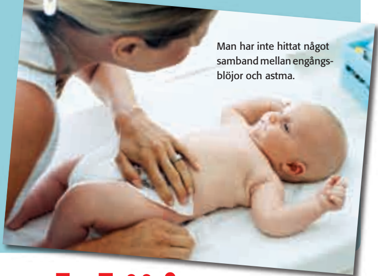
Man har inte hittat något samband mellan engångsblöjor och astma.