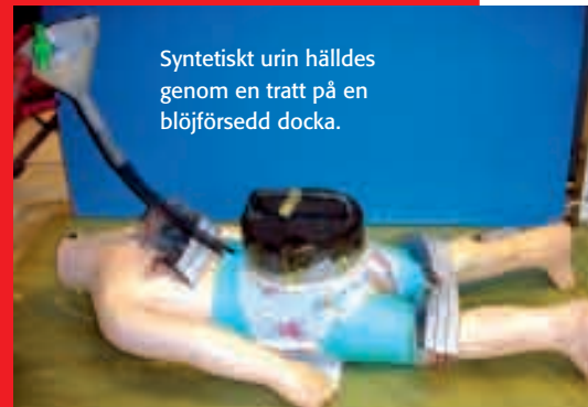
Syntetiskt urin hälldes genom en tratt på en blöjförsedd docka.

– Vi har en betydligt längre tradition att jobba med tillverkare av tvättmedel och mjukpapper. Det kan också vara en orsak till varför så få blöjtillverkare har Svanen, menar hon. ■