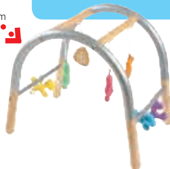
Apricas babygym säljs än så länge bara i Italien.

Den svenska importören har valt att inte släppa gymmet på den svenska marknaden.